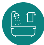
KOUPELNA A WC