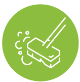
PODLAHA A POVRCHY

Řada čisticích prostředků Ladi pro profesionální úklid domácnosti je na trhu už více než dvacet let. Za tu dobu se může pochlubit nejen celou řadou specializovaných produktů, ale především dokonalými výsledky. To vše s důrazem na lidské zdraví a ekologii.